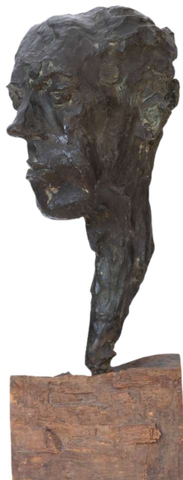
Cabeza de Juan Antonio Gaya Nuño, 1962 Pablo Serrano (Teruel, 1908 – Madrid, 1985)

Por primera vez, se ofrece una visión integral que no solo reúne su colección de arte, sino también el vasto universo intelectual que atesoró a lo largo de su vida: sus creaciones literarias, su obra crítica, libros, artículos y noticias de la época, catálogos históricos y una significativa selección de correspondencia. Este enfoque permite comprender a Gaya Nuño no solo como estudioso y difusor del arte moderno, sino como una figura central de la cultura española moderna.